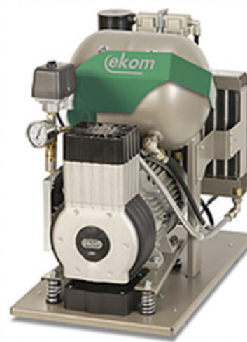
DK50 10Z / M