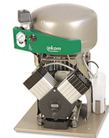
DK50 2V / M