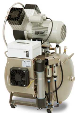
DK50 2V / 50 / M