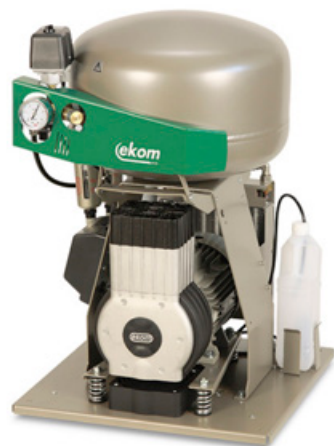
DK50 PLUS / M