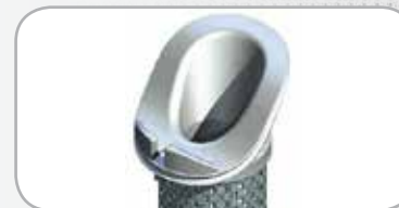
Code couleur éléments filtrants série PF : Blanc