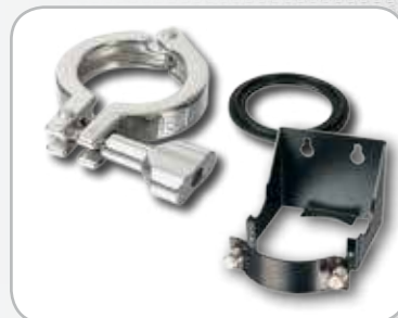
Kits d'assemblage et fixation murale (Option)