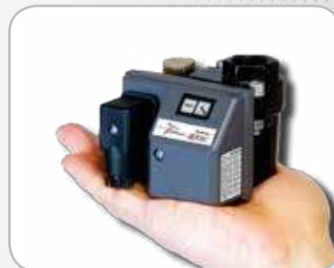
Purgeur Captair Compact optionnel recommandé pour modèles 13 à 17