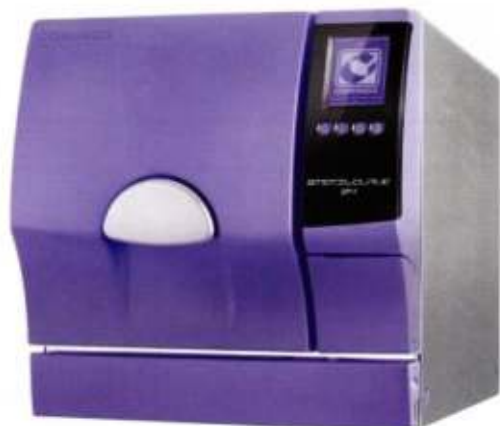
COMINOX France - Catalogue 2017