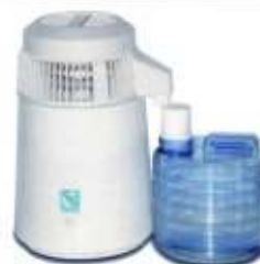
COMINOX France - Catalogue 2017