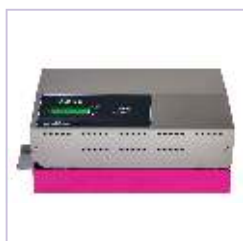
Soudreuse TS 45