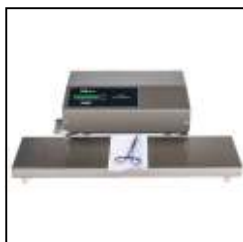
Soudreuse TS 45D avec table lisse