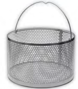
Panier de chargement